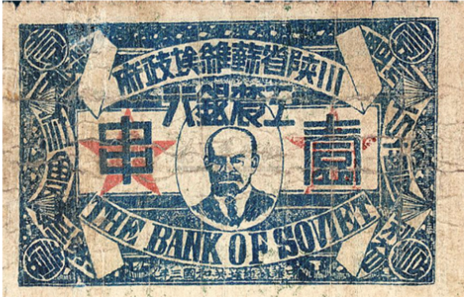
1933 年川陝省苏维埃政府工农银行壹串