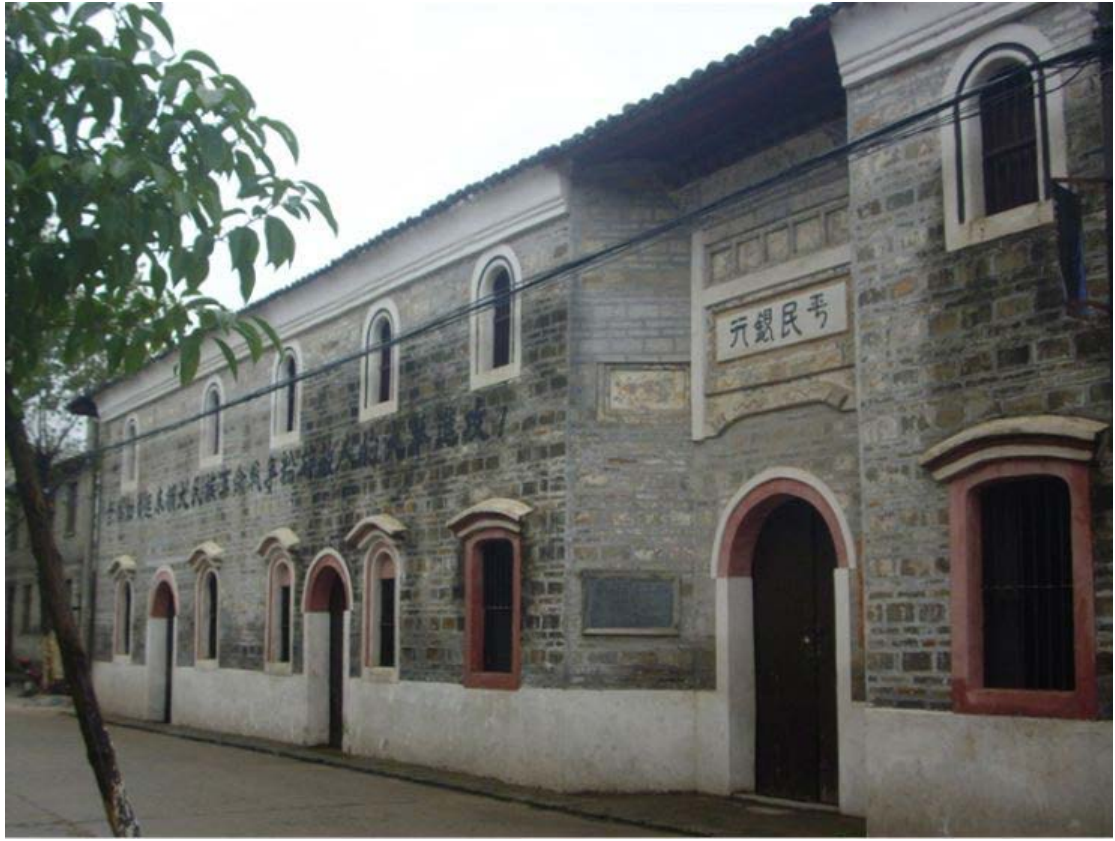
东古平民银行旧址