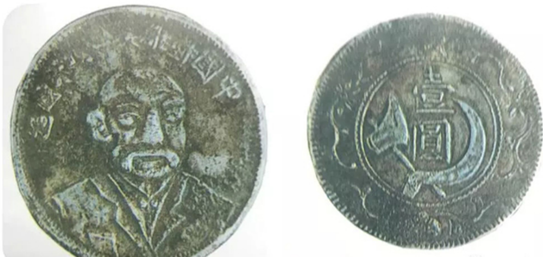
鄂北农民银行铸造发行的马克思头像银币

1931 年夏，洪湖苏区发生严重水灾。湘鄂西省苏维埃政府发行水利借券，筹措 30 万元资金，以为整修水利工程之用。借券条例全文为：（一）本券是为必要的水利经费，只占整个水利经费的百分之二十。（二）本券为无息借券，以明年的土地税作担保，各县按照本县水利经费的百分之二的数目来省府领取推销，后来按照所推销的数目全部收回，送交省府焚毁。（三）本券推销的对象，是赤白区域的商人和富农，其它热心水利者，可按自己经济力量自愿承销。（四）本券必须百分之百的用在整顿水利上面，绝对不准移作他用。（五）本券与“借据”性质相同，能够出售，但不能购买货物。