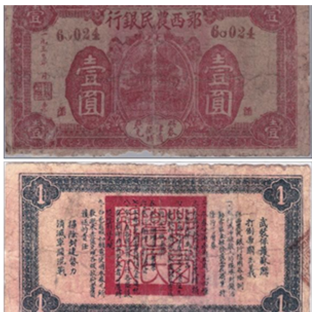
鄂西农民银行 1930 年壹圆篆体“武”字版

“鄂西纸币”的印发和流通时期正处于革命斗争的白热化阶段。票面的设计理念和构图元素，也“如实地反映了当时革命根据地的斗争形势和革命要求”，比如，将“活动赤区金融完成地方暴动”革命口号印在壹角和贰角信用券的背面，在伍角券和 1930 年壹圆券背面印有“扫除封建势力消灭军阀混战”“武装保护苏联打倒帝国主义”等斗争口号。