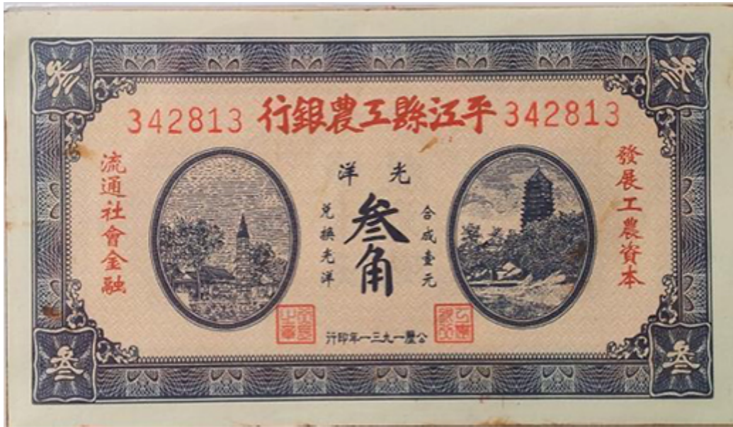
平江县工农银行纸币