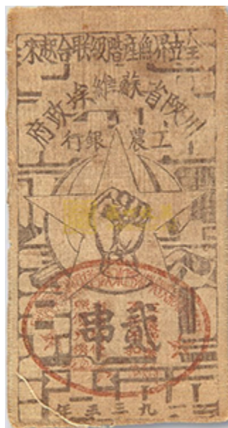
1933年川陕省苏维埃政府工农银行贰串布币