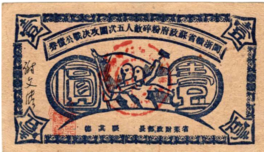
閩浙贛省蘇政府粉碎敵人五次圍攻決戰公債券