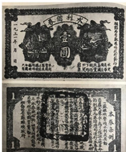
湘鄂西省苏维埃政府水利借券

“鄂西纸币”的印发和流通时期正处于革命斗争的白热化阶段。票面的设计理念和构图元素，也“如实地反映了当时革命根据地的斗争形势和革命要求”，比如，将“活动赤区金融完成地方暴动”革命口号印在壹角和贰角信用券的背面，在伍角券和 1930 年壹圆券背面印有“扫除封建势力消灭军阀混战”“武装保护苏联打倒帝国主义”等斗争口号。