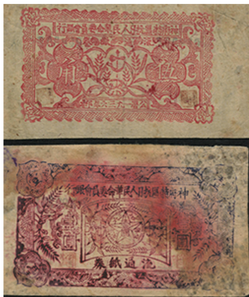
神府特区抗日人民革命委员会银行纸币