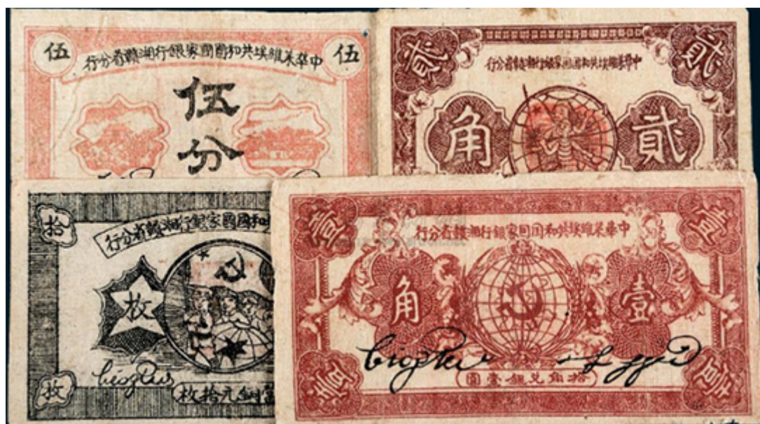
中华苏维埃共和国国家银行湘赣省分行纸币