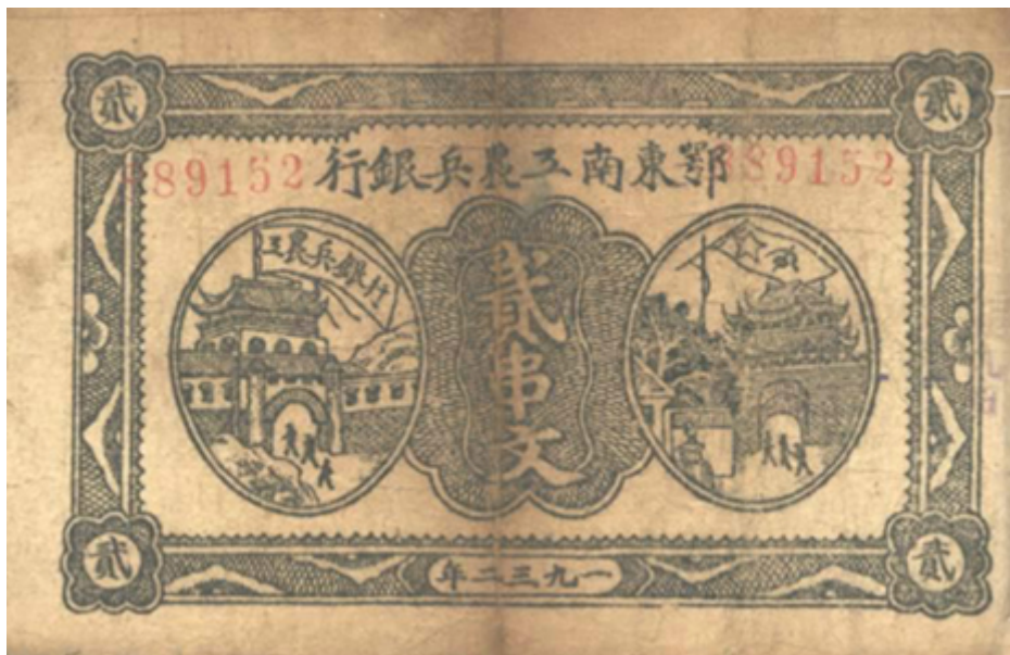
鄂东南工农兵银行贰串文