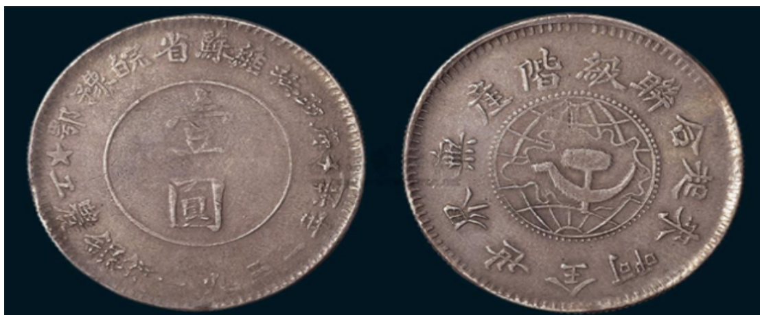
鄂豫皖省苏维埃政府壹圆